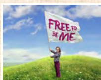
Център за култура и дебат "ЧЕРВЕНАТА КЪЩА" ЗАЛА "ПЕША НИКОЛОВА", ЕТ. 2 „Любен Каравелов“ 15

ЕЗИК: АНГЛИЙСКИ, НЕМСКИ СУБТИТРИ: БЪЛГАРСКИ