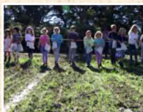
"ЧЕРВЕНАТА КЪЩА" ЗАЛА "ПЕША НИКОЛОВА", ЕТ. 2 „Любен Каравелов“ 15