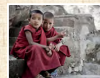
Център за култура и дебат "ЧЕРВЕНАТА КЪЩА" ЗАЛА "ПЕША НИКОЛОВА", ЕТ. 2 „Любен Каравелов“ 15