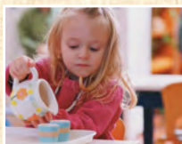
Център за култура и дебат "ЧЕРВЕНАТА КЪЩА" ЗАЛА "ПЕША НИКОЛОВА", ЕТ. 2 „Любен Каравелов“ 15