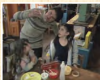
Център за култура и дебат "ЧЕРВЕНАТА КЪЩА" ЧЕРВЕНА ЗАЛА, ЕТ. 1 „Любен Каравелов“ 15

ЗАЩО ТЕЗИ ДЕЦА ОБИЧАТ УЧИЛИЩЕ 57 мин. WHY DO THESE KIDS LOVE SCHOOL