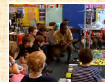
Център за култура и дебат "ЧЕРВЕНАТА КЪЩА" ЗАЛА "ПЕША НИКОЛОВА", ЕТ. 2 „Любен Каравелов“ 15